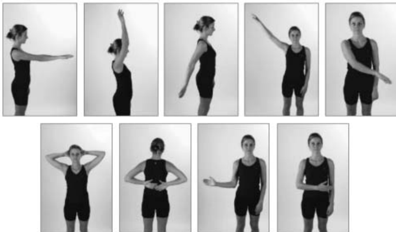
Figura 2 - Movimentos do ombro. Flexão, elevação, extensão, abdução e adução (acima). Abdução + rotação externa, adução + extensão + rotação interna, rotação externa, rotação interna (abaixo) (5) .