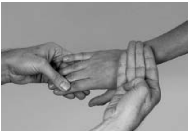
Figura 1 - Avaliação de calor articular em punho, com o dorso da mão do examinador (6) .

observadas, como eritema em articulações inflamadas (1,3) . Além disso, a atrofia muscular deve ser descrita quando presente, pois esta indica desuso, doenças neurológicas ou processo inflamatório adjacente (3) . As crepitações articulares podem ser encontradas em articulações normais, mas estalos importantes indicam processos crônicos degenerativos.