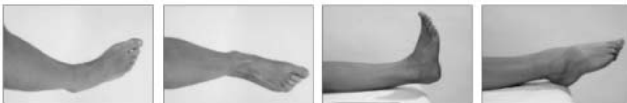
Figura 7 - Movimentos do tornozelo da esquerda para direita: inversão + supinação, eversão + pronação, dorsiflexão e flexão plantar (5) .