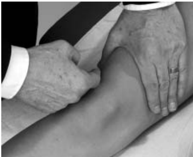
Figura 6 - Mostrando o sinal da bochecha (5) .