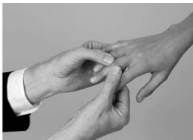
Figura 4 - Palpação das articulações metacarpofalangeanas à esquerda, e das articulações interfalangeanas proximais à direita (5) .